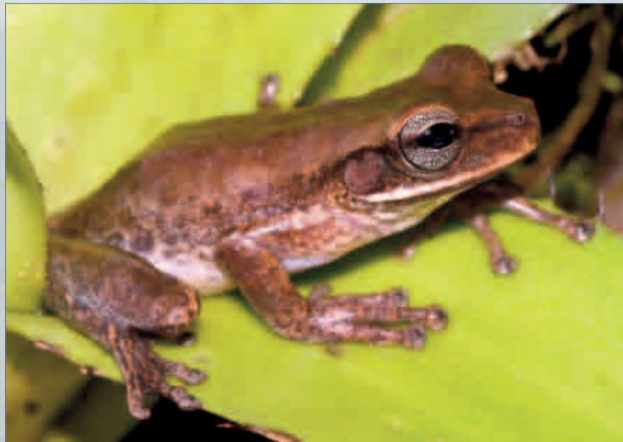
Tepuihyla talbergae , otro endemismo del Parque Nacional Kaieteur, en ocasiones aparece con Colostethus beebei en las mismas bromeliáceas

de la neblina, lo que sugiere que esta especie depende de la gran humedad relativa que proporciona la neblina.