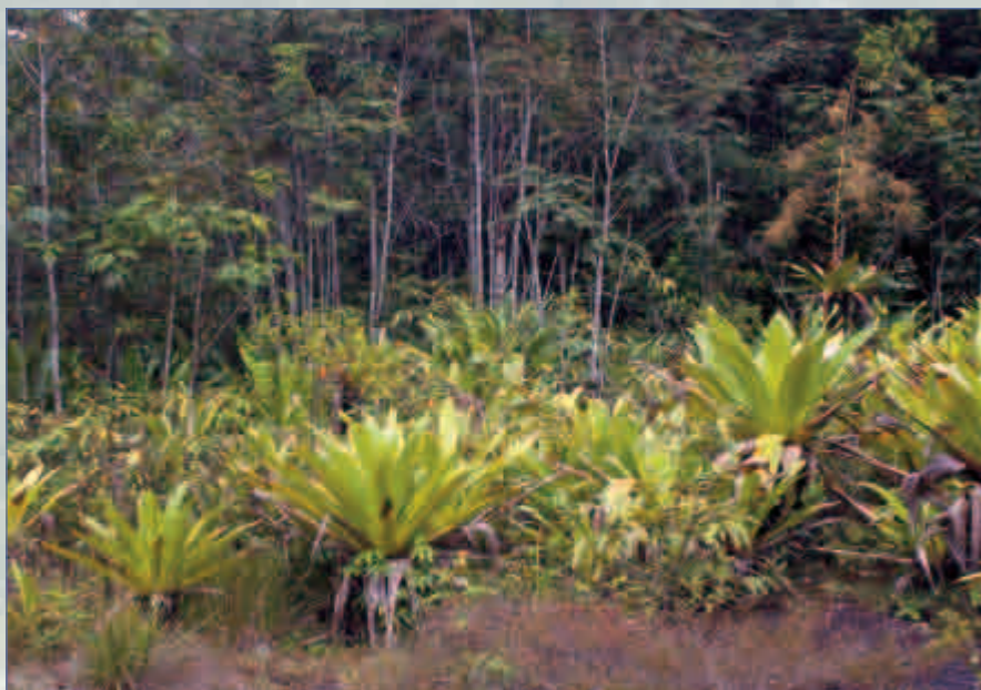
Hábitat típico de Colostethus beebei en la meseta del río Potaro