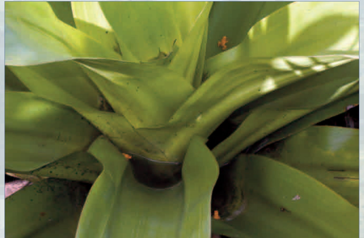
Al menos tres Colostethus beebei habitan en esta bromeliácea terrestre gigante

En los últimos 10 ó 20 años las poblaciones de muchas especies de Colostethus han disminuido a escala local; algunas especies antes abundantes hoy escasean. COLOMA (1995) constató el declive de las poblaciones ecuatorianas de algunas