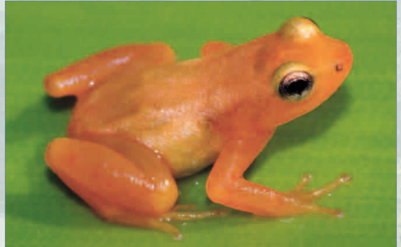
Primer plano de un ejemplar de Colostethus beebei de la variedad naranja

secas marrones, mientras que la variedad amarilla es observada más a menudo sobre hojas verdes vivas. Realizamos observaciones similares: encontramos unas cuantas ranas amarillas sobre hojas secas marrones, pero muy pocas ranas pardas sobre hojas verdes.