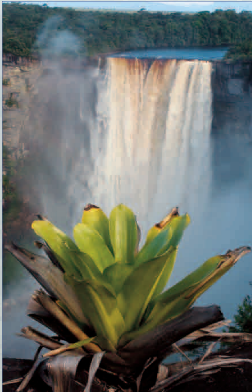
Brocchinia micrantha , biotopo exclusivo de Colostethus beebei , con las cataratas Kaieteur al fondo