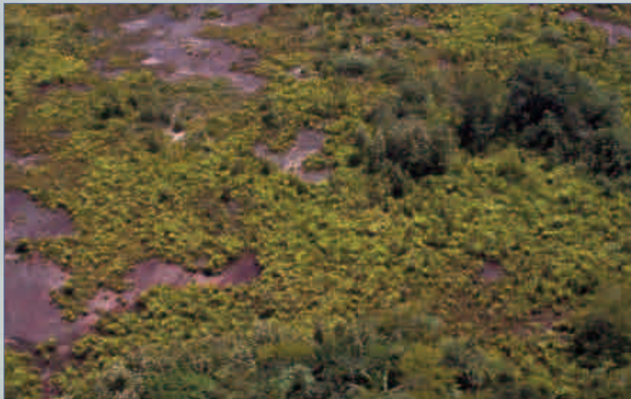
Vista aérea del tepui Kaieteur con matas de Brocchinia micrantha , donde aún abunda Colostethus beebei