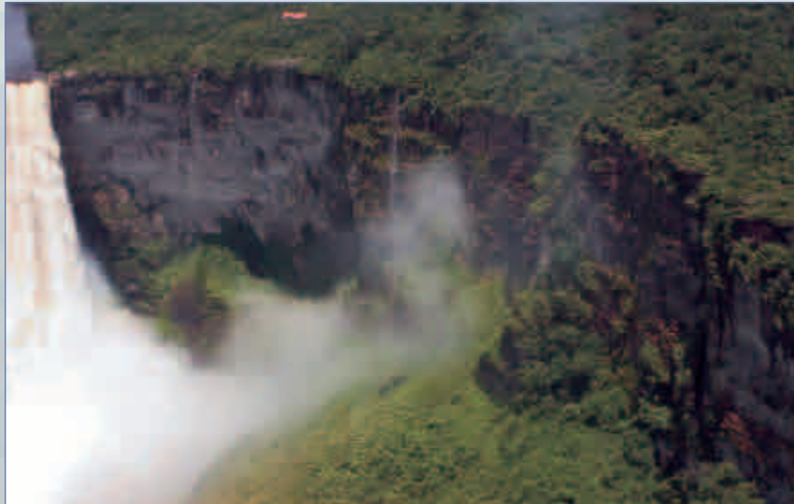
La niebla que se eleva de las cataratas forma un hábitat de selva nubosa ocupado por especies especializadas

BOURNE (2001) observó que la variedad parda de C. beebei es observada más a menudo sobre hojas